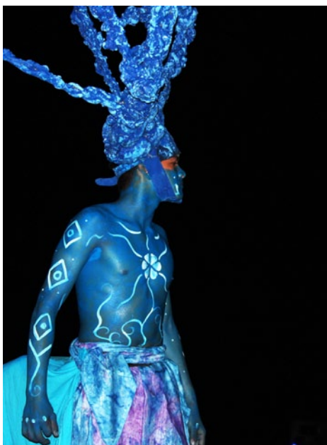
Mexikos regering bjöd på en spektakulär show på torsdagskvällen vilket även erbjöd ett bra tillfälle för alla deltagare att mingla och prata om vägen framåt.