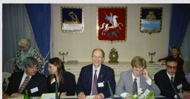
Alltid positiv, drivande och nytänkande. Här vid ett möte hos talmanen i den ryska Duman. Till vänster paret Dumas från Dallas, experter på kärnvapenkrig av misstag. Till höger två ryska studenter.