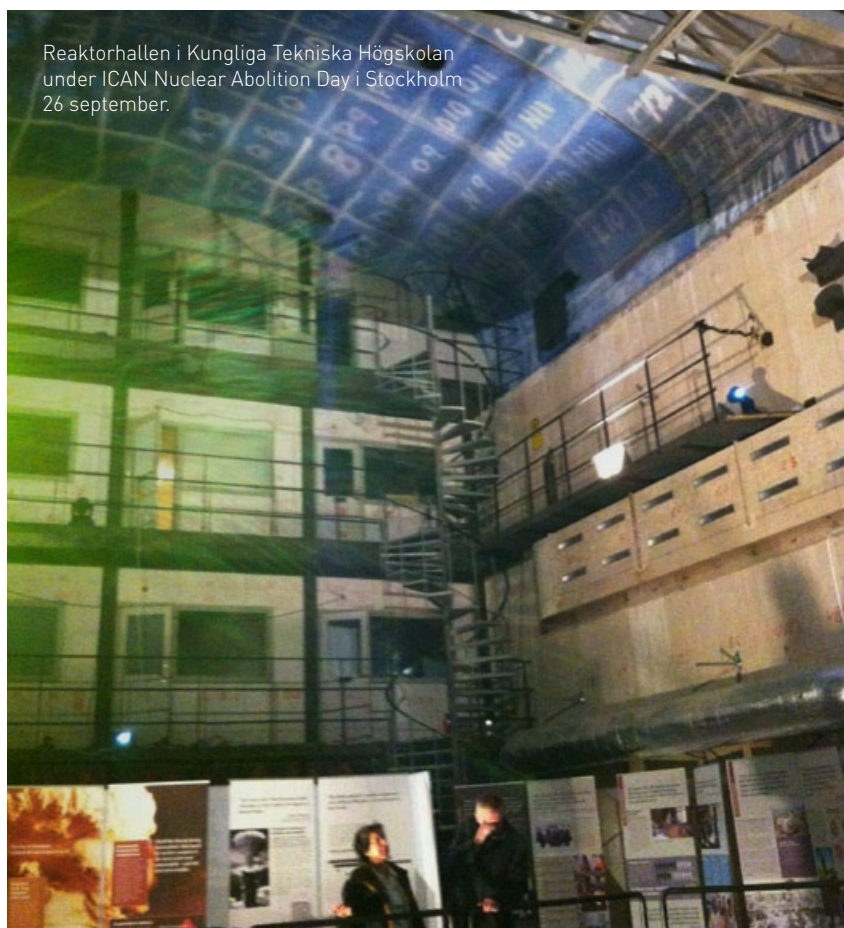
Reaktorhallen i Kungliga Tekniska Högskolan under ICAN Nuclear Abolition Day i Stockholm 26 september.