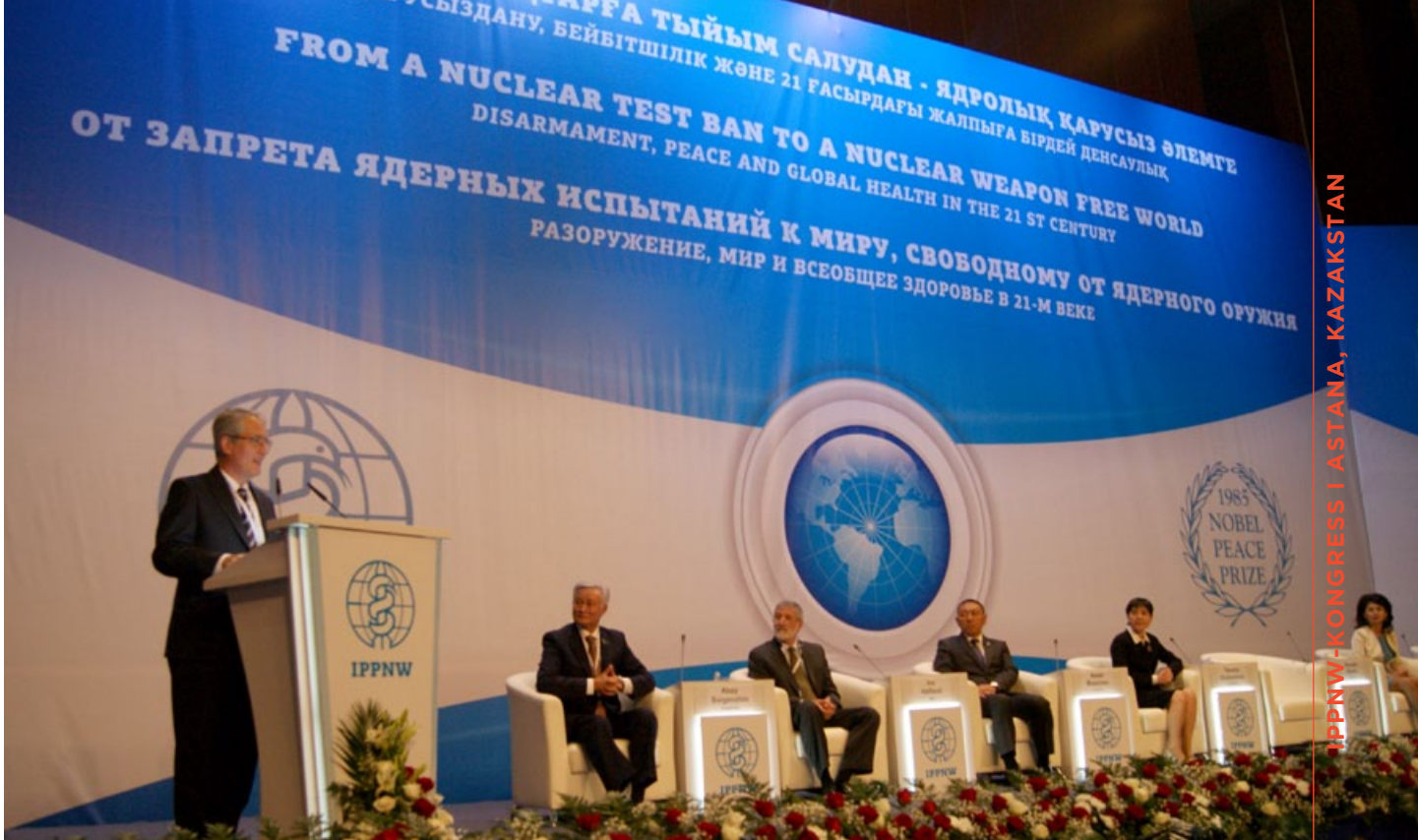
▲ I kongressen deltog 250 läkare och medicinstudenter från 40 länder samt många från Kazakstan.