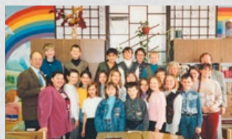
En av Hans många skolor i Moskva som kopplades ihop med SLMK:s "Shape your Future".