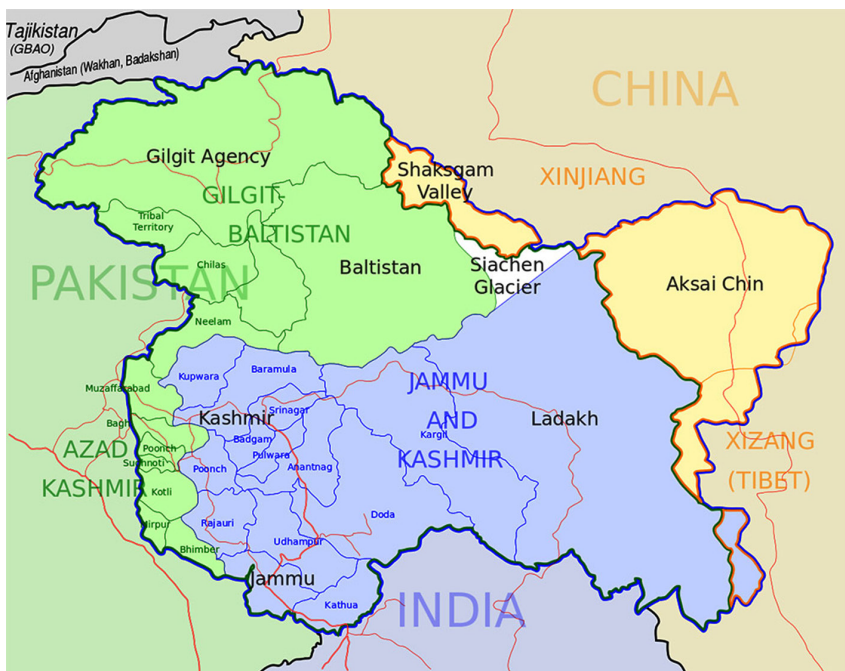
▲ Karta över Kashmir. Pakistanskt område grönt, indiskt blått.