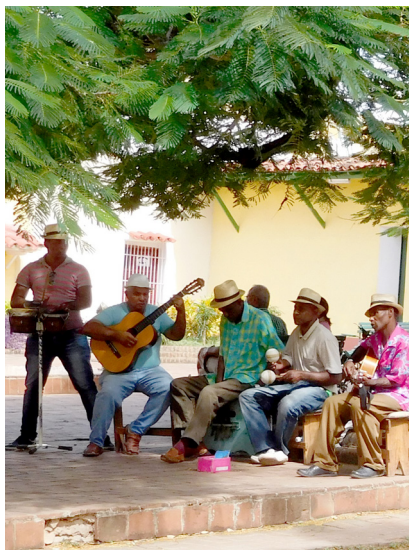
▲ Gatumusikanter är ett vanligt inslag i stadsbilden i Havanna.