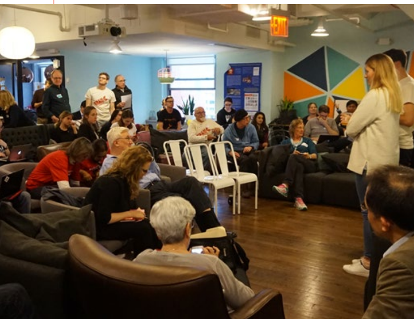
▲ På ICAN Campaigners meeting samlades engagerade personer från världen över för att delta i workshops och planera inför förbuds-förhandlingarna.