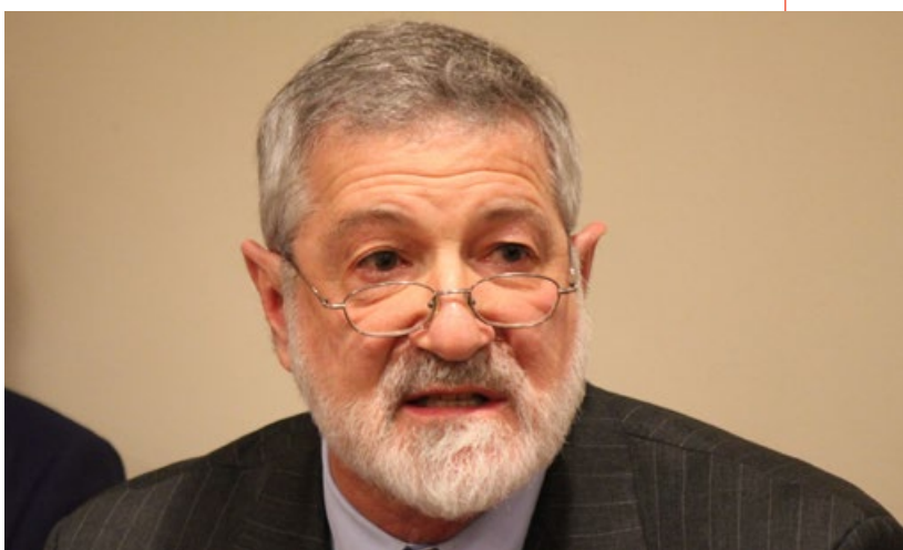
▲ Ira Helfand, co-president för IPPNW beskrev för presskåren under presskonferensen hur ett kärnvapenkrig riskerar att försätta nästan två miljarder människor i svält.