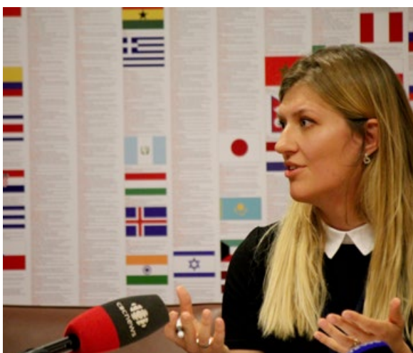
▲ Beatrice Fihn, chef för ICAN, höll en presskonferens i reaktion till USAs FN-ambassadör Nikki Hayleys protest mot förbudsförhandlingarna.