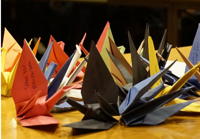
▲ Efter att förhandlingarna var avslutade delades papperstranor ut till alla som deltagit på konferensen. Papperstranor är en symbol för en kärnvapenfri värld och för nedrustning.