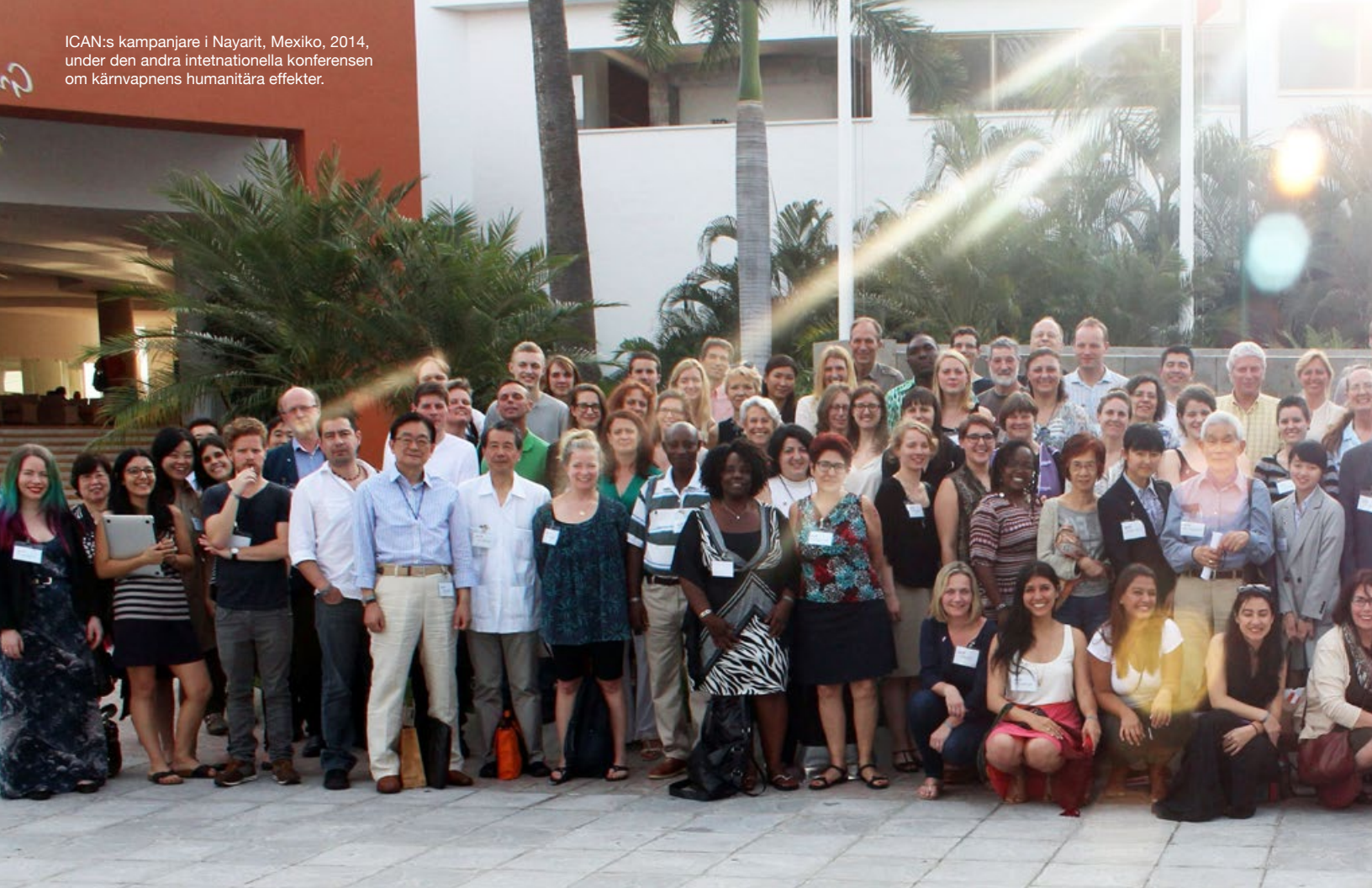
ICAN:s kampanjare i Nayarit, Mexiko, 2014, under den andra internationella konferensen om kärnvapnens humanitära effekter.