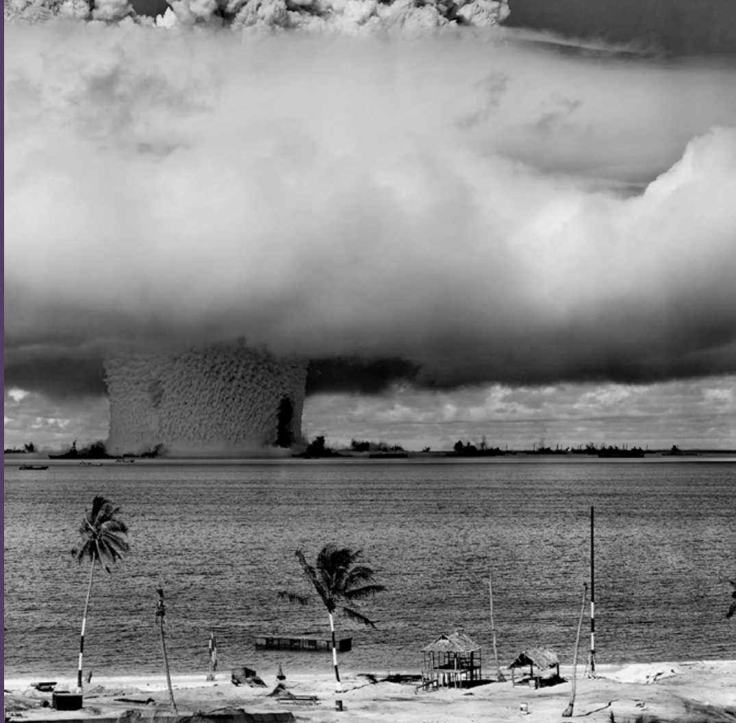
Bild: USA provspränger ett kärnvapen under vattnet vid Bikiniatollen, Marshallöarna, 1946. Bomben hade en sprängkraft på 23 kiloton, snäppet större än bomben över Hiroshima, men flera hundra gånger mindre än "Castle Bravo", USAs största kärnvapen som provsprängdes 1954.