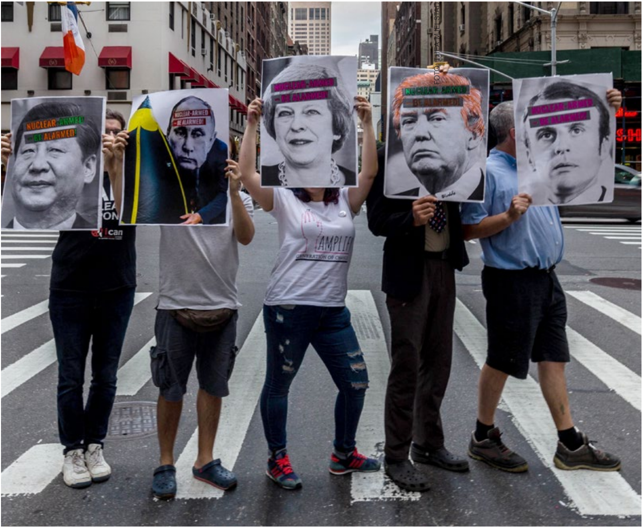
▲ Alla kärnvapenstater var välkomna att delta i förhandlingarna om FN:s konvention om ett kärnvapenförbud, men ingen av dem var på plats under förhandlingarna. Hela processen som ledde fram till förbudet var ju faktiskt från början en reaktion på att de fem officiella kärnvapenstaterna nonchalerat sitt ansvar (enligt NPT) att nedrusta.