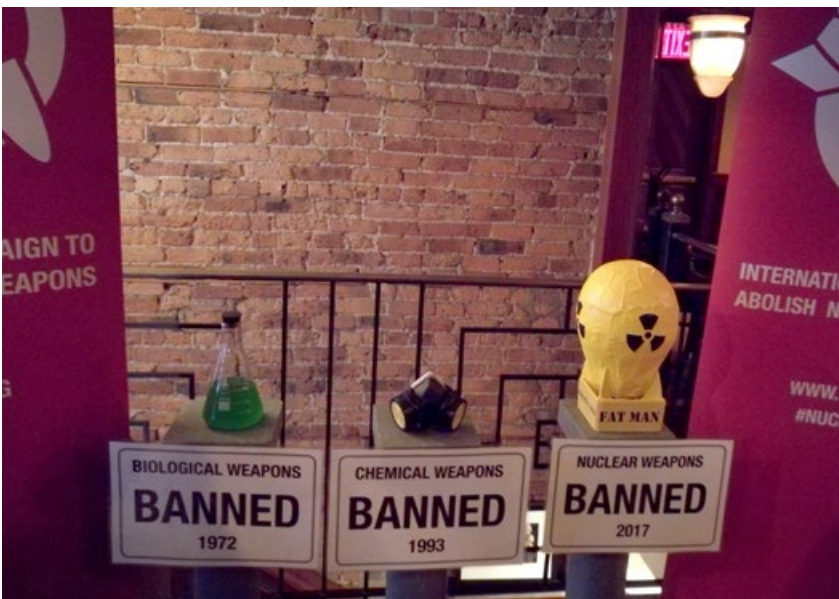
▲ Kärnvapnen hamnar nu äntligen på samma plats i historien som biologiska och kemiska vapen. Den 7 juli antogs en FN-konvention om ett förbud mot kärnvapen. Konventionen träder ikraft när 50 stater har ratificerat avtalet. När tidningen gick i tryck hade 53 stater signerat avtalet och 3 stater ratificerat.