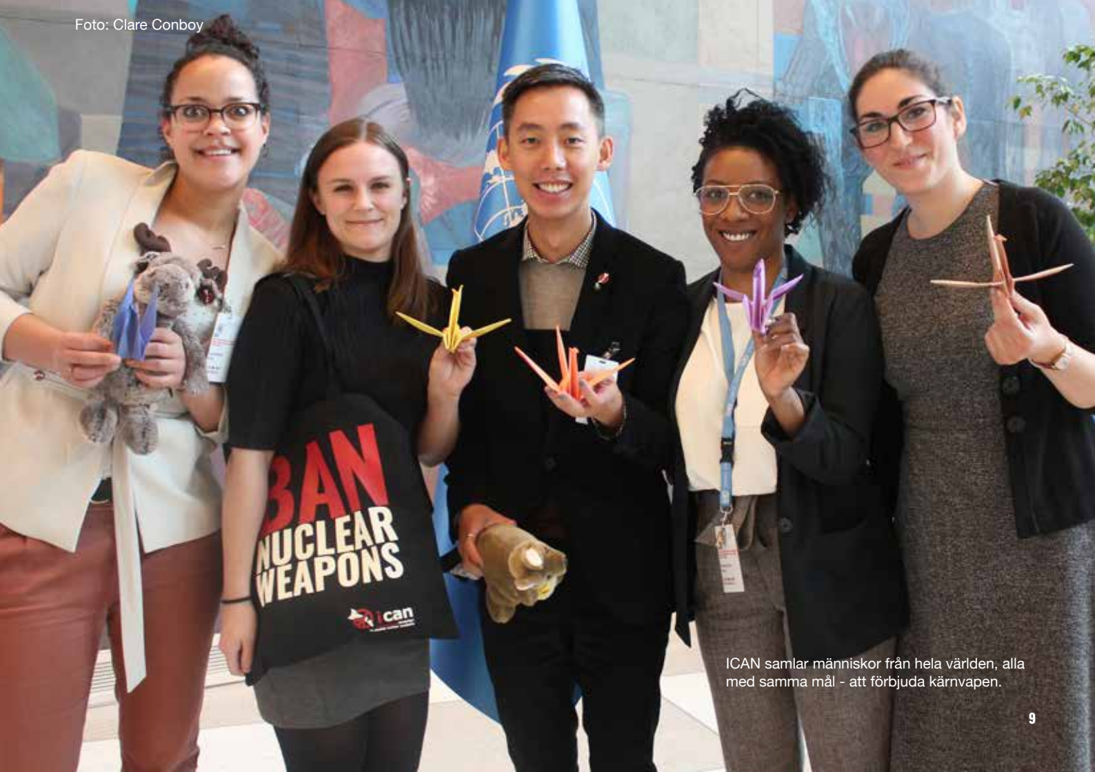
ICAN samlar människor från hela världen, alla med samma mål - att förbjuda kärnvapen.