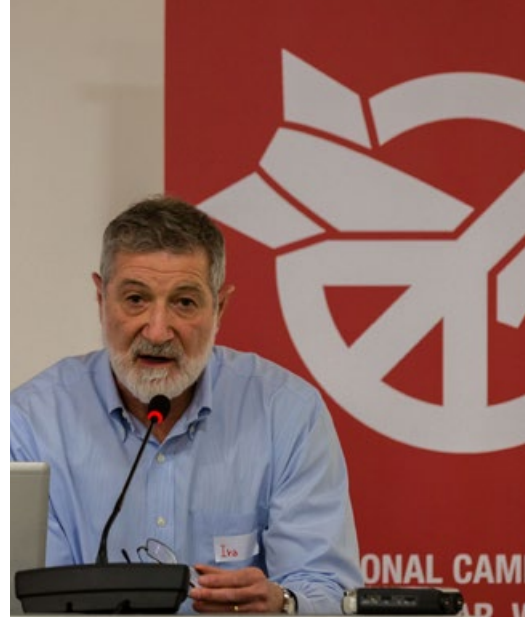
▲ Ira Helfand, co-president för IPPNW, pratade om humanitära konsekvenser av kärnvapen och om strategier för ICAN.