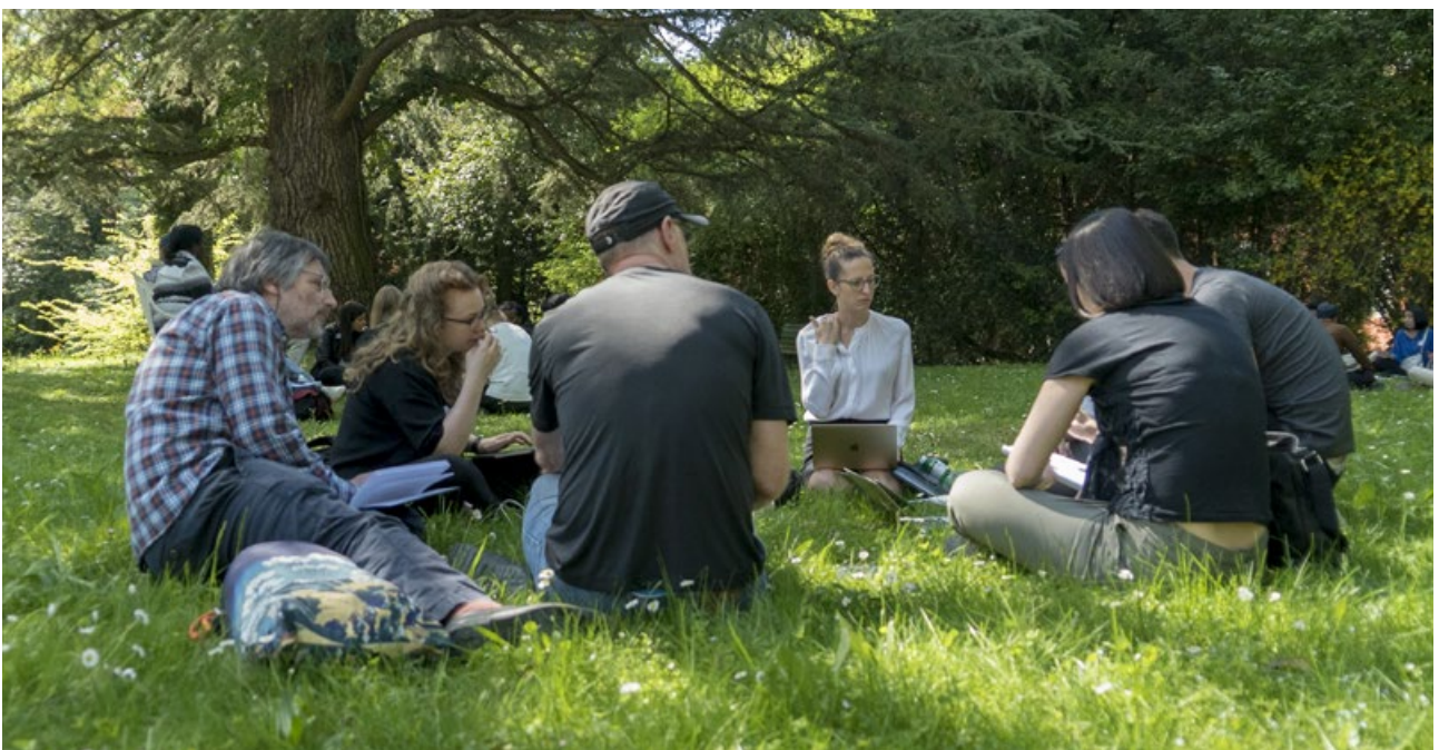
▼ Helgen präglades av praktisk planering i regionala och tematiska grupper för att planera framåt, ända fram tills konventionen träder i kraft.