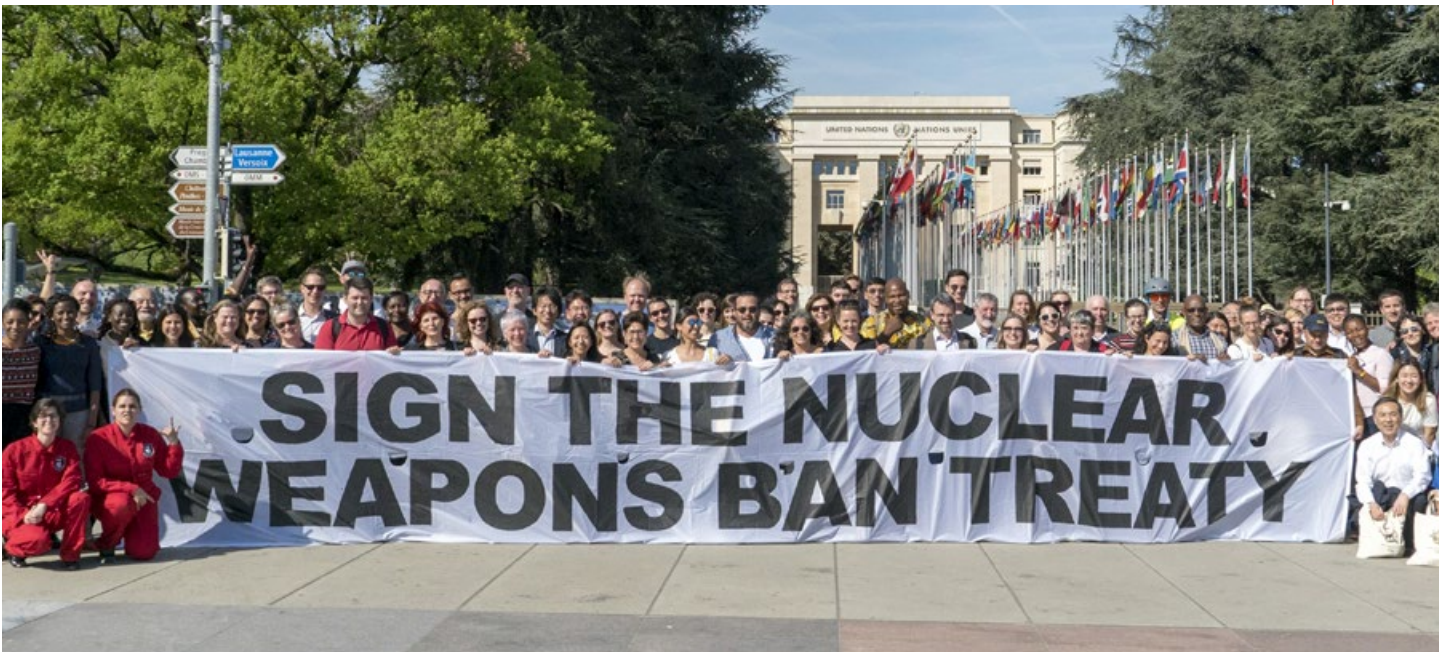
▲ ICAN Campaigners meeting samlade ett hundratal kampanjare från hela världen inför öppnandet av NPT:s förberedande möte i Genève i slutet av april.