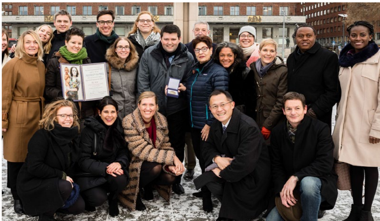
Glada medlemmar i ICAN:s styrgrupp poserar med medaljen och diplomaten dagen efter utdelningen av Nobels fredspris 2017.